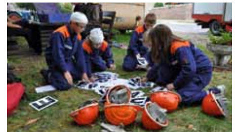
„Spiel ohne Grenzen“ der Jugendfeuerwehren