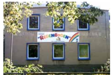
Kinder- und Jugendfreizeitzentrum „Regenbogen“