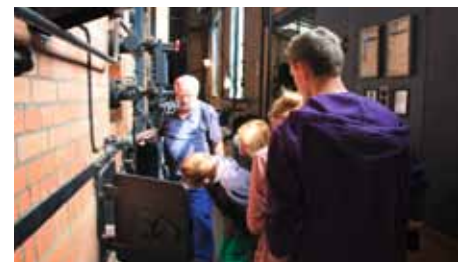
Familienführung im TD BF Louise