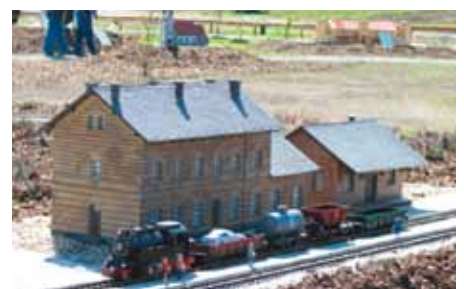
Miniaturen-Park – Modell „Bahnhof Elsterwerda-Biehla“