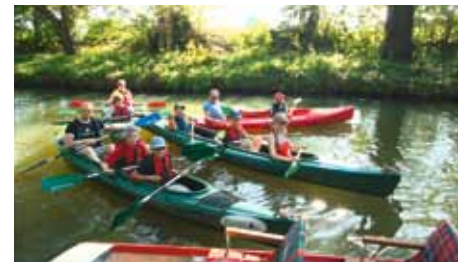
Freizeit auf dem Wasser