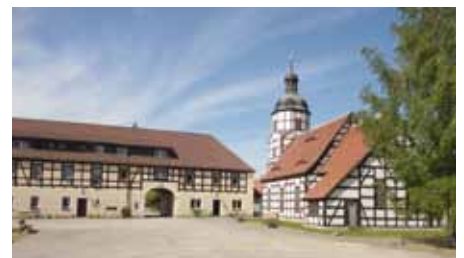
Fachwerkkirche in Saathain