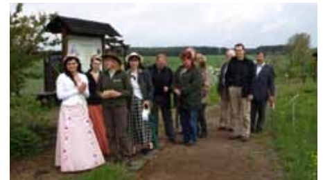
Pomologischer Schau- und Lehrgarten Döllingen