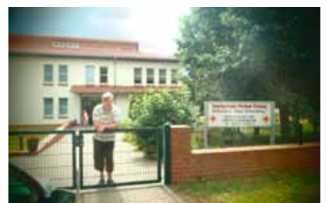
DRK – „Haus Winterberg“