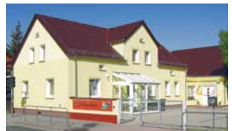
Bibliothek in Prösen