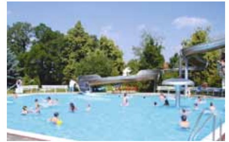
Erlebnisbad Tröbitz geöffnet von Mai bis August

In Oppelhain präsentiert der Kräutergarten auf 4000 Quadratmetern etwa 350 verschiedene Pflanzenarten der Umgebung. Ein besonderer Anziehungspunkt ist die Paltrockwindmühle. Auf dem Mühlengelände gibt es nicht nur einen „Barfußpfad“ und einen „Max-und-Moritz-Pfad“ zu erkunden, sondern dort findet auch zweimal jährlich, zu Pfingsten und im Oktober der traditionelle Mühlenmarkt statt. Bei bäuerlichem Marktreiben und traditionellen Handwerk rund um die Mühle kann der Besucher die vielfältigen Angebote genießen. Seit Juli 2001 existiert eine Greifvogelstation, in der hilfebedürftige Greifvögel aufgenommen und versorgt werden.