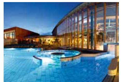
Lausitztherme Wonnemar