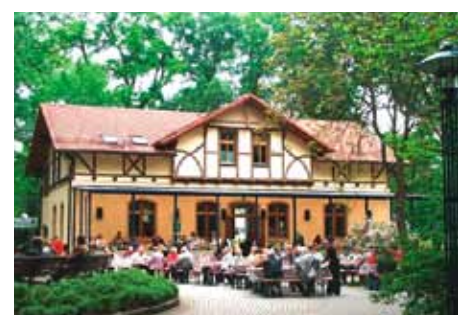
Kurkonzert am Haus des Gastes