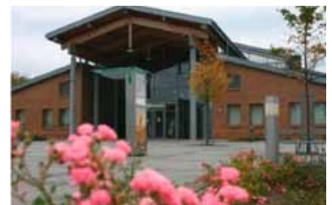
Haus des Gastes