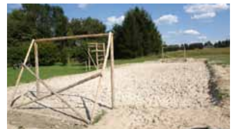
Schlammfußball in Staupitz