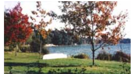
Naherholungsgebiet „Körbaer Teich“