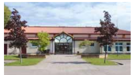
Turnhalle – Oberschule Massen