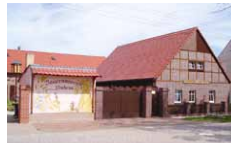
Bauernmuseum Lindena Anmeldung unter Tel.: 03532698110