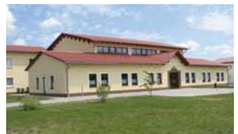
Bürgerhaus in Haida