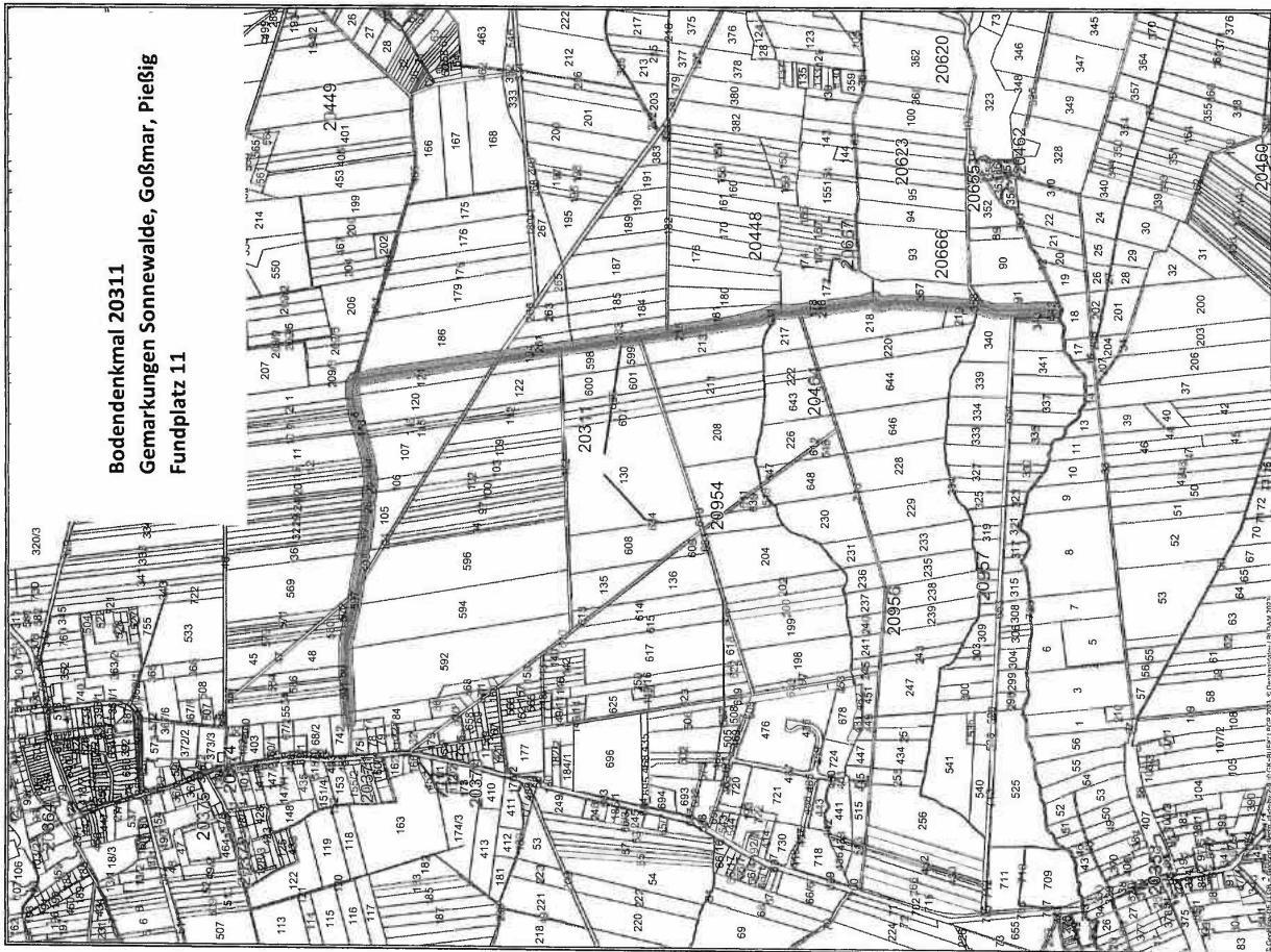
Bodendenkmal 20311 Gemarkungen Sonnenwalde, Gofsmar, Pießig Fundplatz 11

„Auszug aus der Liegenschaftskarte – Rechtsinhaber: Land Brandenburg“