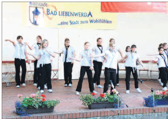
Großen Beifall für seine Darbietungen erntete der „Tanzladen 04“ aus Bad Liebenwerda.