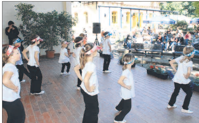
Bei schnellen Rhythmen war Mitklatschen angesagt.