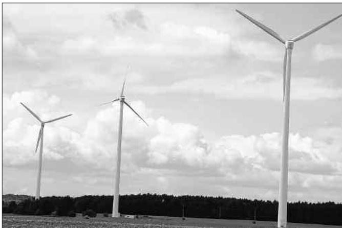
Es dreht sich was im Landkreis: Kein Stillstand ist beim Baugeschehen zu verzeichnen. In den nächsten Monaten entstehen u. a. 40 neue Windkraftanlagen.